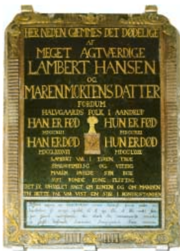
Tekst og foto: Jens Chr. Jensen Grafik: ic-foto, Esbjerg Tryk: Toptryk, Gråsten

»Jeg kan ikke nægte, at jeg havde Lambert kær, og dette må opfattes så tvetydigt, at jeg altid ham og han altid mig havde kærest; således har den afdødes herre sagt, således har han ladet skrive på mindesmærket Krogsgård år 1790«